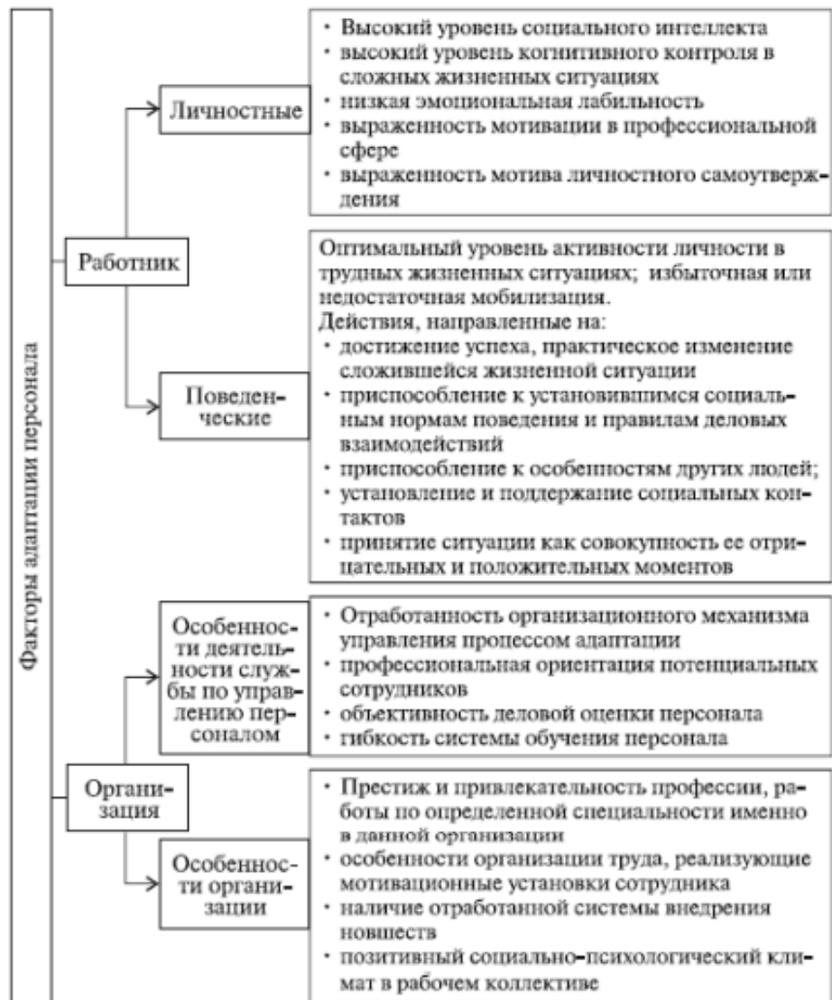
Рисунок 2 – факторы адаптации по И.Б. Дураковой

Е.Г. Черникова считает, что адаптация молодых педагогов в учреждениях образования определена совокупностью внешних (объективных) и внутренних (субъективных) факторов. Но доминирующими факторами являются внутренние, связанные с личностью работника. Ведущими внешними факторами, влияющими на процесс социально-профессиональной адаптации, являются: уровень материального благосостояния, престиж профессии учителя в обществе, средства массовой информации, образовательная среда. Ведущими внутренними факторами выступают: фактор мотивации, фактор профессиональных ценностей и профессионально значимых качеств, самообразование [5].