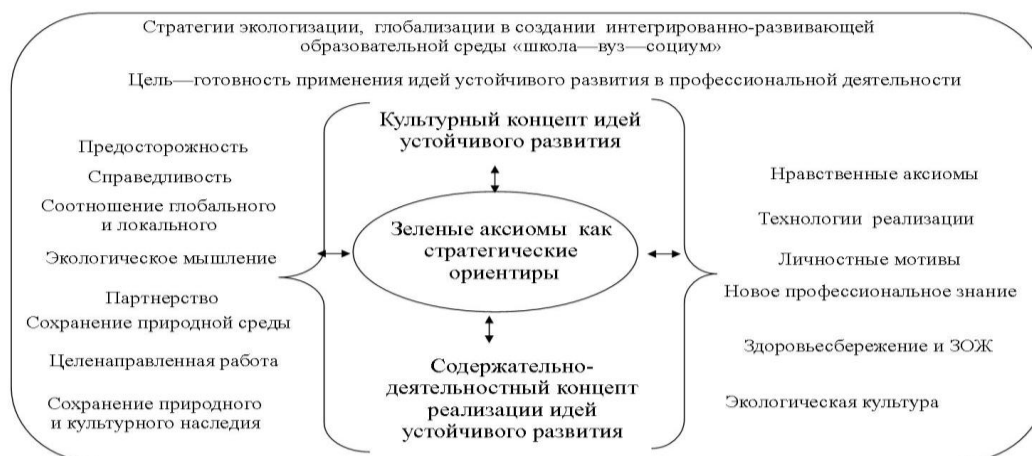
Рисунок 1– Организация процесса на основе «зеленых аксиом»

Приведем пример из нашей практики по реализации идей устойчивого развития. Нами разработана и апробирована учебная дисциплина «Модель устойчивого развития образовательного сообщества», которая осваивается студентами в соответствии с требованиями ФГОС ВО направления подготовки 44.04.01 Педагогическое образование, уровень (бакалавриат, магистратура).