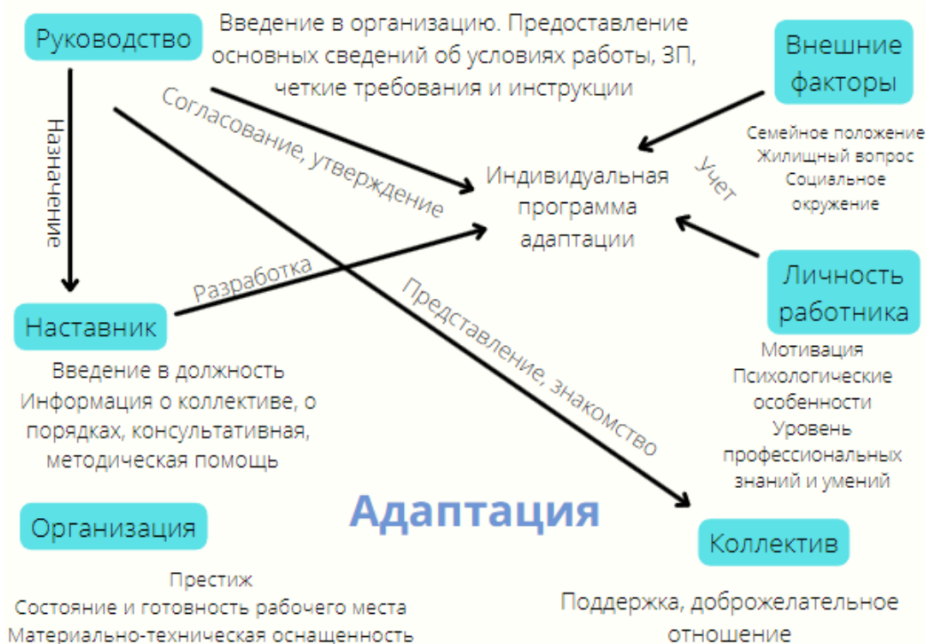
Рисунок 3 – система адаптации молодого специалиста

Качественная модель управления адаптацией, которая будет учитывать комплекс факторов, оказывающих влияние на молодого специалиста, позволит сделать процесс профессиональной адаптации максимально эффективным для сотрудника и организации. Для новичка должна быть разработана индивидуальная программа адаптации с учетом личностных особенностей и потребностей работника. Руководство подробно знакомит сотрудника с основными требованиями, назначает наставника, представляет коллективу, знакомит организацией. Наставник должен подбираться на основе совместимости, личных пожеланиях как молодого специалиста, так и наставника. Наставник рассказывает о трудностях в работе, и о наиболее распространенных ошибках в работе, о коллегах. Задача коллектива – создать наиболее благоприятную психологическую обстановку, помогать новичку при необходимости, беседовать. Хороший климат в коллективе, внимание со стороны руководства, помощь наставника создадут у молодого учителя ощущение защищенности, уменьшат боязнь неудачи, помогут избежать ошибок, сформируют позитивное отношение к профессии, обязанностям и окружению. Молодой специалист, который хорошо проинструктирован, знает, к кому обратиться по возникающим вопросам, испытывает доверие к руководителю будет мотивирован на качественную работу.