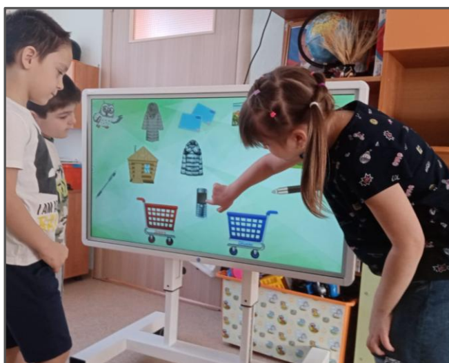
Рисунок 1– Программно-аппаратный комплекс «Колибри» с программным обеспечением «Сова»

В своей работе мы активно используем информационные технологии. В частности интерактивный комплекс «АЛМА» - «Финансовый гений» и программно-аппаратный комплекс (ПАК) «Колибри» с программным обеспечением «Сова». (Фото 1)