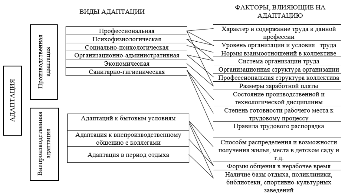
Рисунок 1 – факторы адаптации по А.Я. Кибанову

Данные факторы будут совпадать с факторами по А.Я. Кибанову, так как авторы используют одну и ту же классификацию видов адаптации. Однако В.Р. Веснин включает факторы, связанные с личностью работника, что отсутствует у А. Я. Кибанова. Но классификация А.Я Кибанова подробнее и включает в себя более широкий круг вопросов адаптации. Так, в рамках производственной адаптации присутствует санитарно-гигиеническая адаптация и отдельным блоком указана внепроизводственная адаптация [3, с. 359].