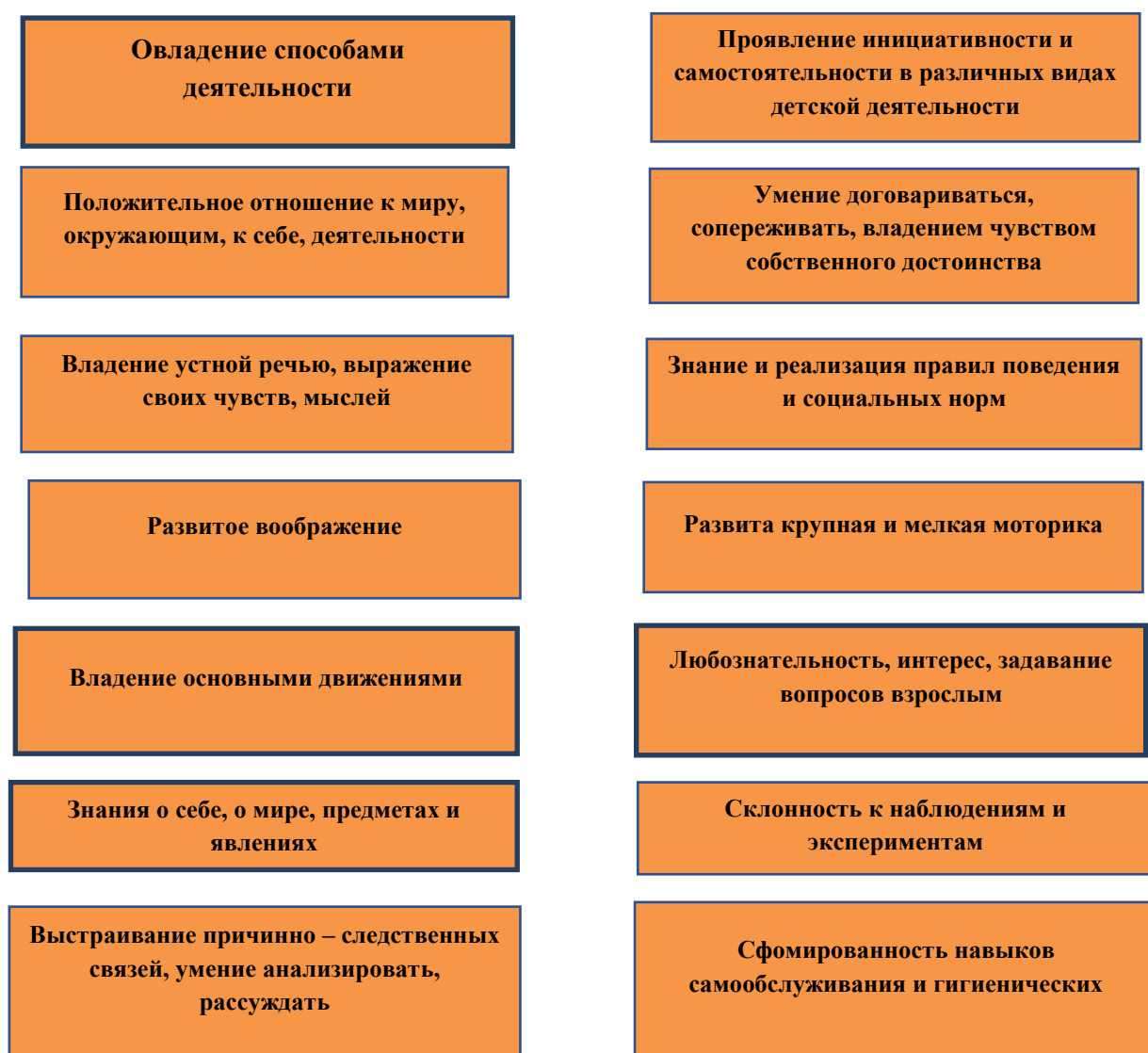
Рисунок 1– Требования к целевым ориентирам на этапе завершения дошкольного образования

Если рассматривать Федеральный государственный образовательный стандарт дошкольного образования, можно выделить следующие требования к целевым ориентирам на этапе завершения дошкольного образования, представленные на рисунке 1. [5]